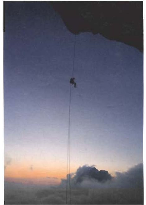
In den Schweizer Alpen wird der Abenteuergeist durch die erhabene Einsamkeit erhöht. Aufnahmezeit: Objektiv SIGMA 18-200 mm F3,5-5,6 DC. Belichtungszeit 1/10 Sekunden, f4,8.